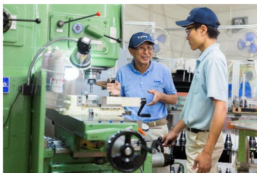
若手技能者への指導風景

当社では、500人を超える従業員を抱えておりますが、一人ひとりの成長の可能性は無限であり、人は「財」という意味を込めて「人財育成」を掲げております。若い技能者にはこれからも現状に満足することなく、自らの成長のため、資格取得等には積極的に取り組んでもらいたいです。また、引き続き技能者育成のため積極的な支援を行ってまいります。