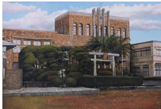
戸上電機製作所 本社工屋

当社は、佐賀市大財北町に本社を置く東証二部上場の配電・制御機器の総合メーカーです。1925年（大正14年）の創業以来、配電機器である開閉器や水質浄化設備など、社会インフラの充実に寄与する多種多様な製品を全国へ送り出してきました。また、中国や東南アジアをはじめとした、積極的な海外展開も行っております。