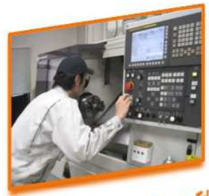
CAD/NCオペレーション科