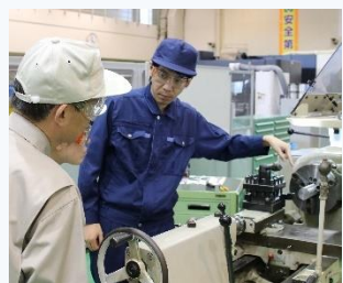
▲ 難削材の切削加工実習