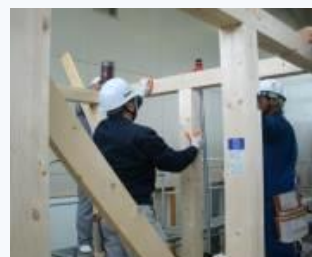
▲ 木造軸組加工法による建物組立の実習

「ハロートレーニング-急がば学べ-」とは、新たなスキルアップにチャレンジするすべてのみなさんをサポートする公的職業訓練の愛称とキャッチフレーズです。