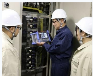
▲ 電気設備のトラブル対策実習