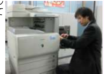
作業準備を行う宍粟氏