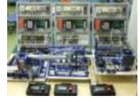
総合制作課題で制作したFAモデル