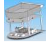
研究開発課題で製作した“自動追尾搬送機”