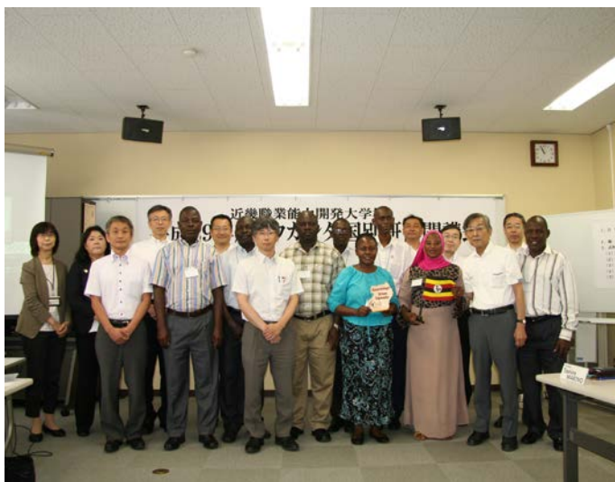
▲集合写真の様子です。

当大学校が蓄積した技術・技能を、習得して頂いた様子でした。ウガンダ国においても、当校で習得した技術・技能を活かして頂ければ幸いです。