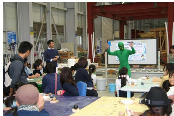
▲ものづくり体験教室の様子です