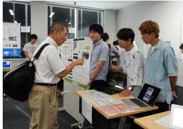
▲デモンストレーションの様子です

翌8月30日(水)に表彰式が開催され、惜しくも入賞は逃しましたが、参加した学生はとても充実した様子でした。