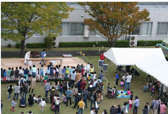
▲ポリテクじの様子です