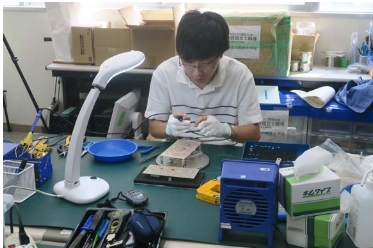
▲山河君の練習風景です。