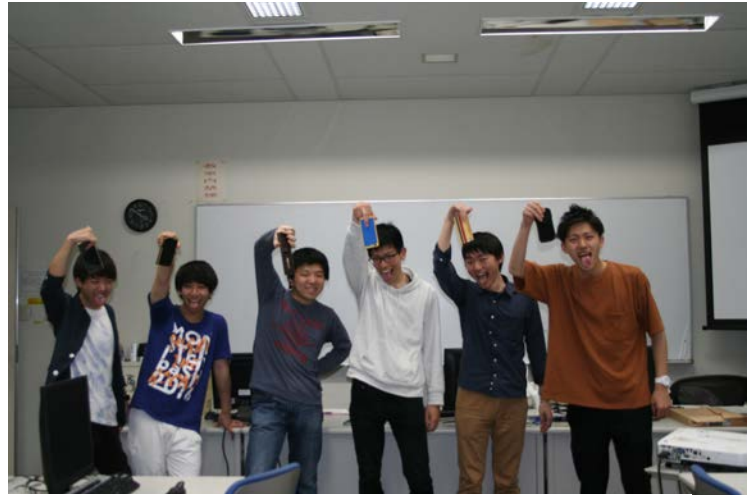
▲部員も充実した様子でした。