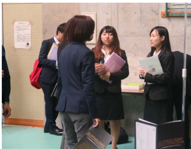
▲真剣に企業担当者の説明を受けている様子です。 ▲質問を熱心に行っている学生の姿が印象的でした。