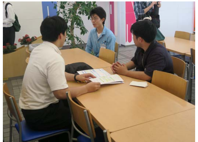
▲個別相談会の様子です。（学生自治会）