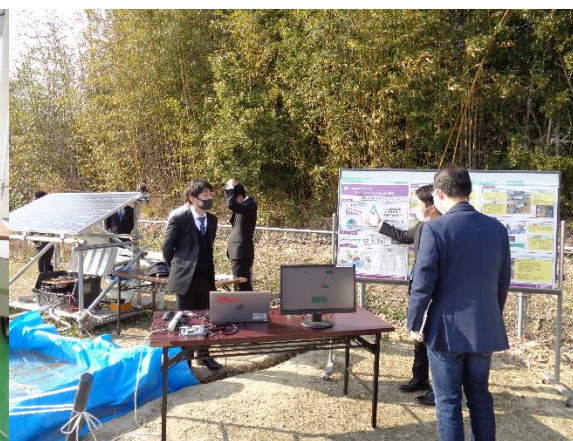
スマートアグリシステムの開発