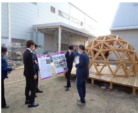
ジオテックドームの製作