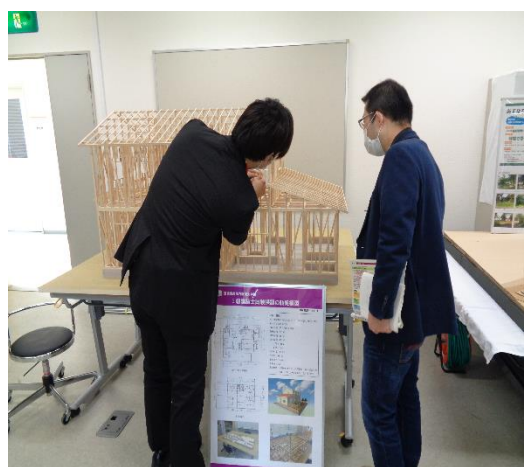
学生向けコンペティション参加による卒業設計