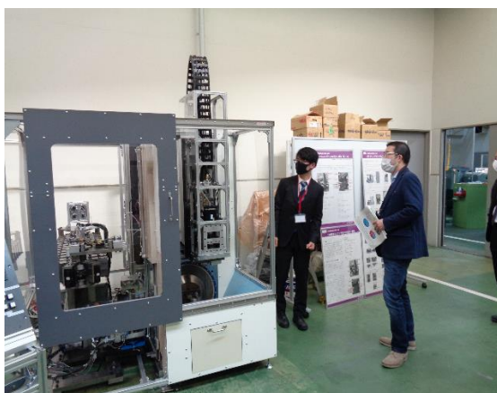
5軸マシニングセンタの製作