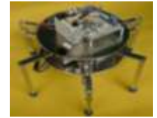
標準課題で制作した六足歩行ロボット