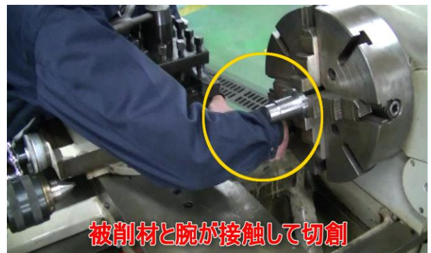
図2 テーパ加工時の災害例

テーパ加工は職業訓練において月に1回程度は行われていると考えられるので、表3よりランク3以上となりマトリックス法を用いてリスクレベルを算出すると、リスクレベルIVと評価され、安全対