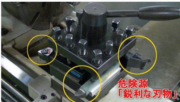
図6 危険源の提示例②