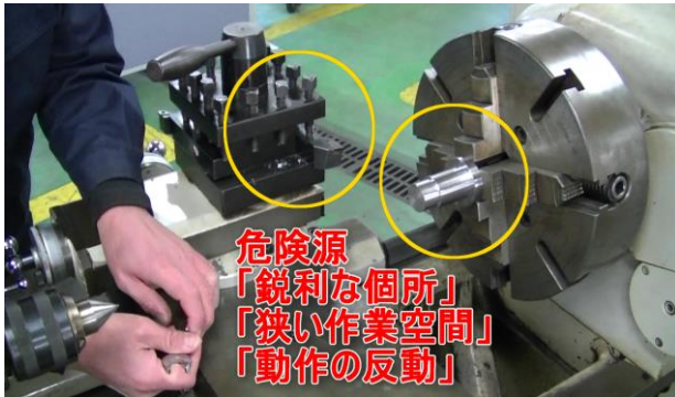
図5 危険源の提示例①

本教材では視聴覚教材である事を重視しているため、全ての項目について動画を挿入した。これらの動画は「作業時の安全な立ち位置」や「効率の良い動き方」を見て理解できるということにもポイントを置いて作成した。