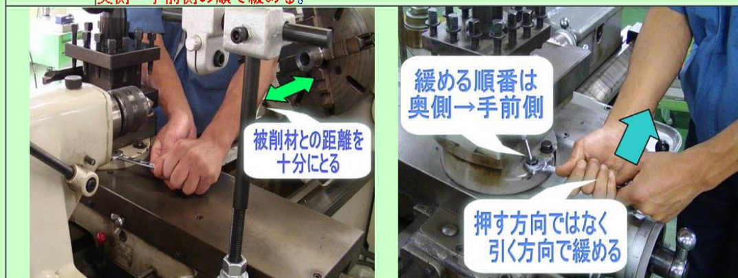
図 4 印刷用画面の一例