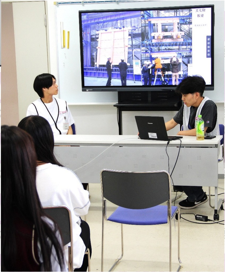
建築系 応用課程ゼミの説明