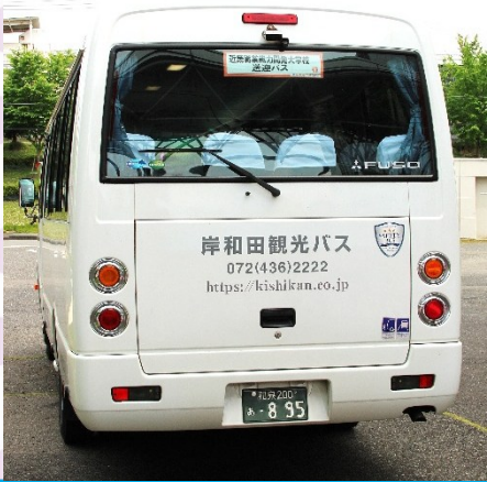
お疲れ様でした！ またお会いしましょう♪