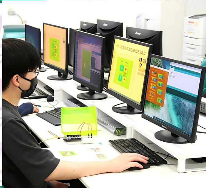
電子情報系 組込みシステム体験