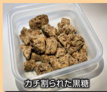
カチ割られた黒糖