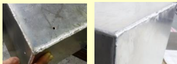
（左）U・Y様が企業実習の初期に製作 （右）同じく後半に製作

航空機部品・特殊機械部品・大型アルミ高品位部品及び大型精密機械部品の製缶、溶接、切削加工