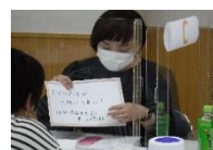
(ものづくり女子ホネットークの様子)

イベントを通じて、就職された方もいます。 参加しているうちに面接にも慣れてくるよ！