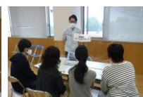
(マッチングカフェの様子)