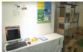
IoTを用いた通知システム

学生時代は、日々の実習で得た知識を基に、IoTを用いて在室状況管理や在庫管理を行える通知システムの作成を行いました。チームで制作を進める中で、ルールの設定や制作物の管理など、個人作業ではあまり意識しない要素についても経験を積むことができました。この経験は、現在の仕事にも役立っています。