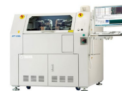
実装基板検査装置