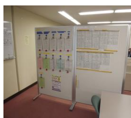
・就職支援室の求人情報