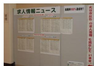
・訓練生ホールの求人情報