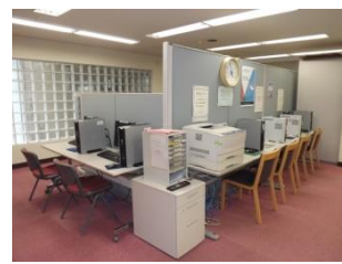
・インターネット検索コーナー