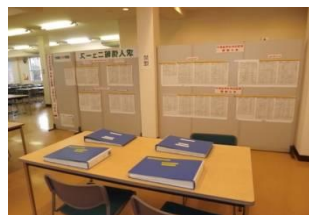
・訓練生ホール求人コーナー