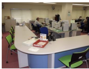
・受付カウンター