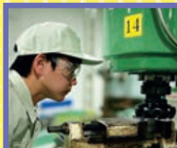
機械加工技術科 若干名

機械部品を製造するために必要な旋盤、フライス盤、NC旋盤の加工技術の技能と知識を習得し、機械部品加工の仕事を目指します。また、企業実習で現場の実務を体験することができます。