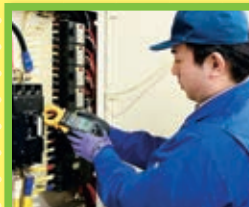
ビル設備科 若干名

生産現場の制御機器等で発生するデータをネットワークで管理・利用するために、PLC・Java言語・ネットワーク・タブレット端末のプログラミング知識・技能を習得し、製造業の製造管理部門・情報部門やシステム開発を行う仕事を目指します。