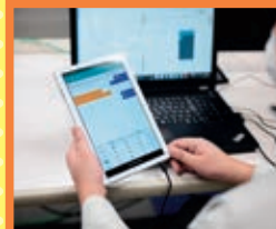
スマート生産サポート科 若干名

電気設備工事、屋内配線設計、シーケンス、CAD、感知器等の消防設備施工・点検などに関する知識・技能を習得し、電気工事や制御盤の仕事を目指します。