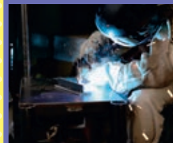
金属加工科 若干名

2次元CAD、3次元CAD・CAM、ワイヤ放電加工、NC旋盤、マシニングセンタなどに関する知識・技能を習得し、CADオペレータや工場での機械加工の仕事を目指します。