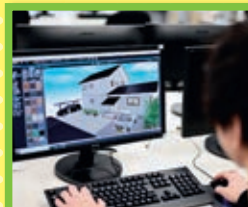
住宅CAD・リフォーム科 若干名

ビル管理・クリーニング、電気設備、空調設備、給排水衛生設備、ボイラー取扱い、危険物取扱い、自動火災報知設備、スプリンクラー・消防設備などについての知識・技能を習得し、施設管理の仕事を目指します。