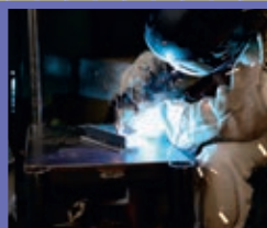
金属加工科 定員15名

2次元CAD、3次元CAD・CAM、ワイヤ放電加工、NC旋盤、マシニングセンタなどに関する知識・技能を習得し、CADオペレータや工場での機械加工の仕事を目指します。