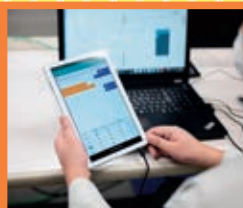
スマート生産サポート科 定員15名

電気設備工事、屋内配線設計、シーケンス、CAD、感知器等の消防設備施工・点検などに関する知識・技能を習得し、電気工事や制御盤の仕事を目指します。