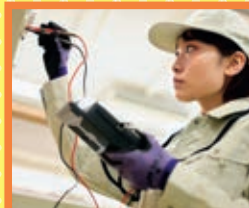
電気設備技術科 定員15名

溶接、板金、図面や展開図、工作作業などに関する知識・技能を習得し、鉄工所などの溶接・板金などの仕事を狙います。