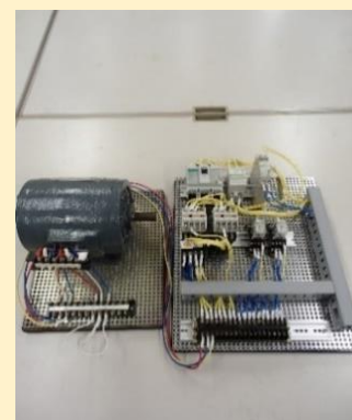
誘導電動機制御 実習装置