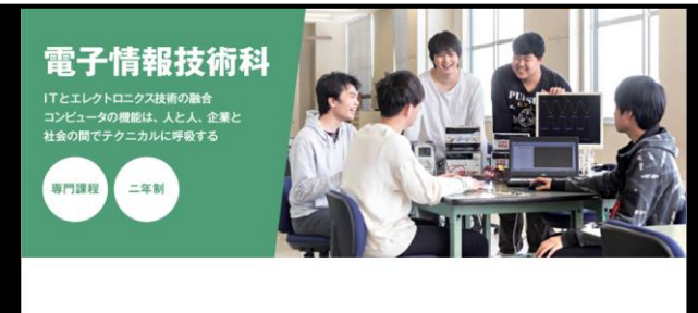
電子情報技術科の説明