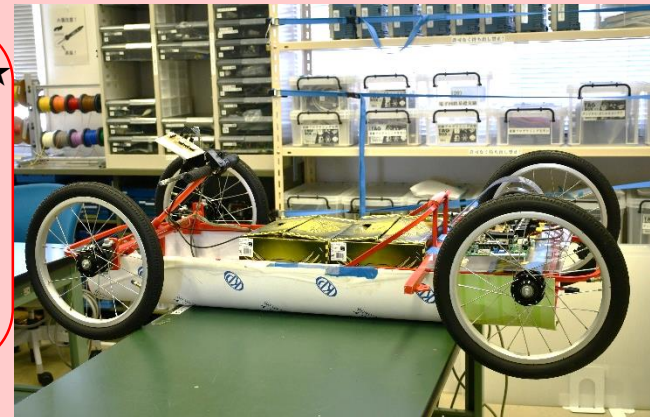
1年次標準課題(3か月間)にて製作