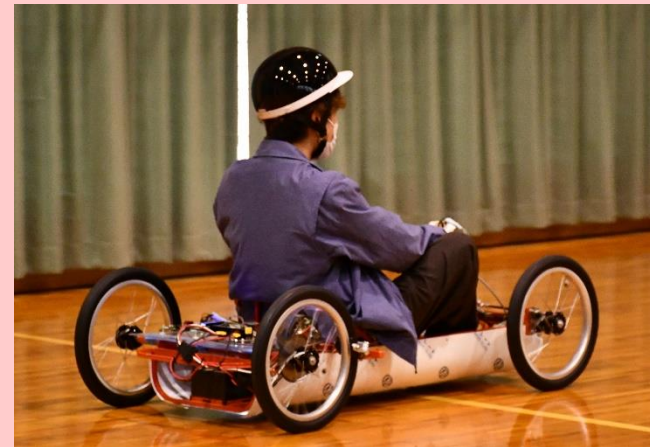
学生がEVカートを試乗しました