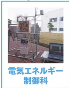
電気エネルギー 制御科