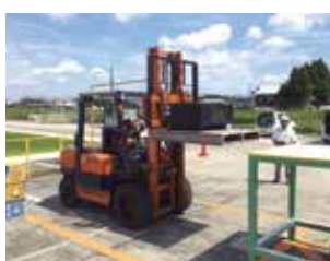
フォークリフト運転

被覆アーク溶接は、被覆アーク溶接棒を使って行う溶接です。手溶接ともいわれ、炭素鋼や各種合金鋼などの溶接に利用でき、装置が簡易で現場でもよく利用されている溶接方法です。