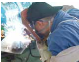
半自動アーク溶接作業