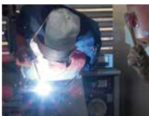
被覆アーク溶接作業