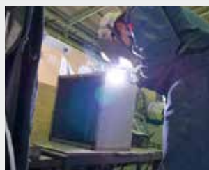
配電ボックスの溶接作業

企業において、溶接作業など本訓練で習得した作業や関連作業を体験し、実務上必要とされる技能・技術及び関連知識を習得します。