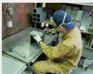
ステンレス製品の加工作業