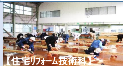
【住宅リフォーム技術科】

建築関係の分野に興味があり、未経験であったため事前に知識や技術を身につけたことから受講を決めました。求めていたことを全て学ぶことができ、結果納得いく会社に就職できたのでとても満足しています。