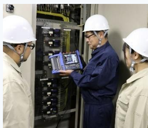
▲ 電気設備のトラブル対策実習