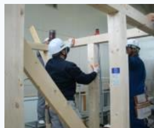
▲ 木造軸組加工法による建物組立の実習

「ハロートレーニング-急がば学べ-」とは、新たなスキルアップにチャレンジするすべてのみなさんをサポートする公的職業訓練の愛称とキャッチフレーズです。