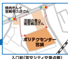
入口前(宮交シティ交差点側)

ポリテクセンター宮崎 南宮崎駅から徒歩5分 宮交シティバスセンターから徒歩3分 駐車場完備240台