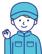
修了生の声 (30代 女性)

CADとNCについては全く知識のないところから入りましたが、基礎と実践の授業で解りやすく、楽しい訓練生活でした。数学が苦手な私には難しい部分もありましたが、製造業に関心と興味を持ち、やる気と自信が持てました。