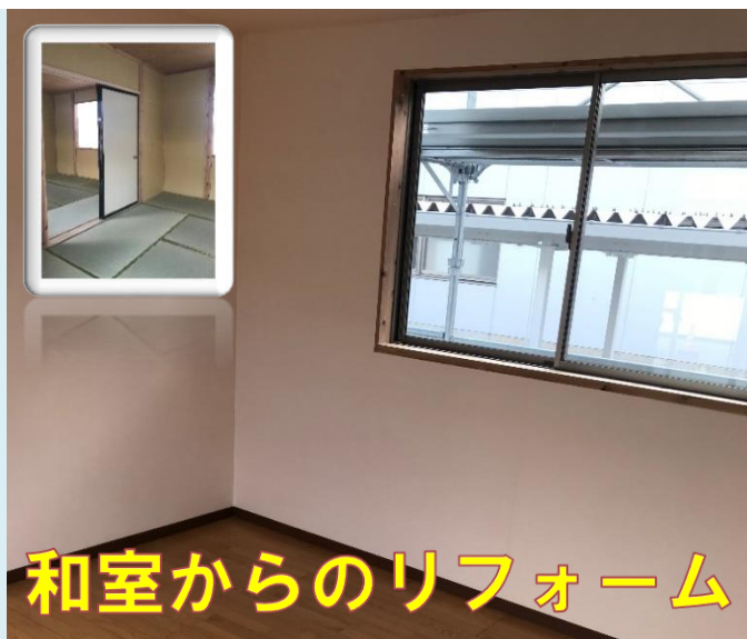
和室からのリフォーム