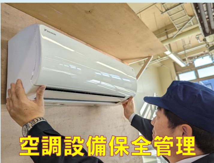
空調設備保全管理