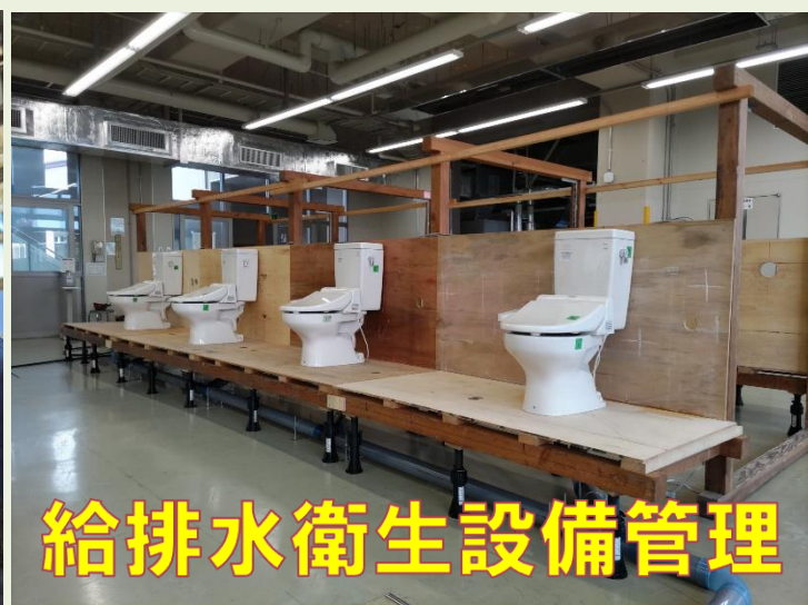
給排水衛生設備管理