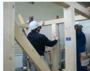
▲ 木造軸組工法による建物組立の実習

「ハロートレーニング-急がば学べ-」とは、新たなスキルアップにチャレンジするすべてのみなさんをサポートする公的職業訓練の愛称とキャッチフレーズです。