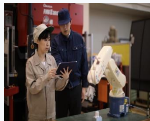
▲ 小型ロボットアームの制御実習