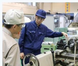
▲ 難削材の切削加工実習