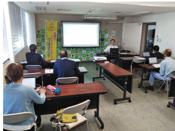
建築2次元CAD(Jw_cad)の操作体験

10月16日(月)にハローワーク四日市にて溶接技術科の訓練体験会を、10月17日(火)にハローワーク鈴鹿にて住宅リフォーム技術科の訓練体験会を実施しました。