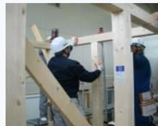
▲ 木造軸組工法による建物組立の実習

「ハロートレーニング-急がば学べ-」とは、新たなスキルアップにチャレンジするすべてのみなさんをサポートする、職業訓練の愛称とキャッチフレーズです。