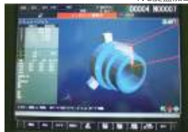
加工シミュレーション