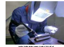
溶接施工技術科 (企業実習付コース)