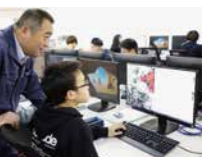
プログラム作成の様子

【情報デザインコース/スマート電気制御コース】 IT社会を形成するコンピュータ、電気・電子、ネットワーク、データベース等の技術を習得します。オフィス内または製造現場におけるデジタル社会に対応できるスペシャリストを目指します。