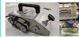
共同研究 (「楮(こうぞ)の表皮剥ぎ機」 黒谷和紙協同組合)

製造現場や地域における課題等に対し専門性を活かして企業等との共同研究・受託研究を行っています。