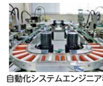
自動化システムエンジニア科