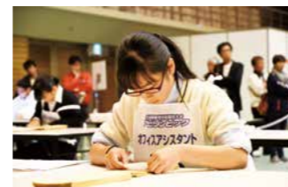
アビリンピック全国大会