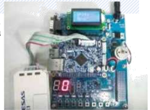
マイコンボード使用イメージ