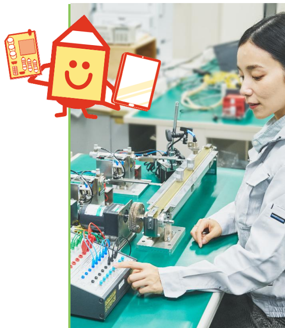
生産ライン メンテナンス科