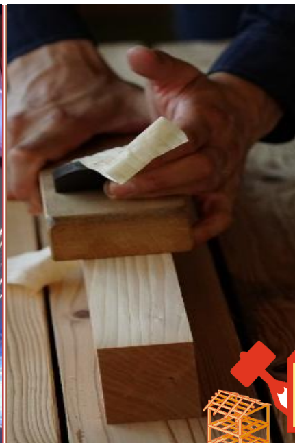
住宅 リフォーム科