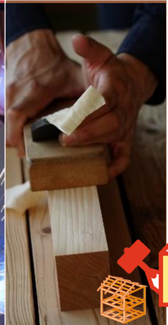
住宅 リフォーム科