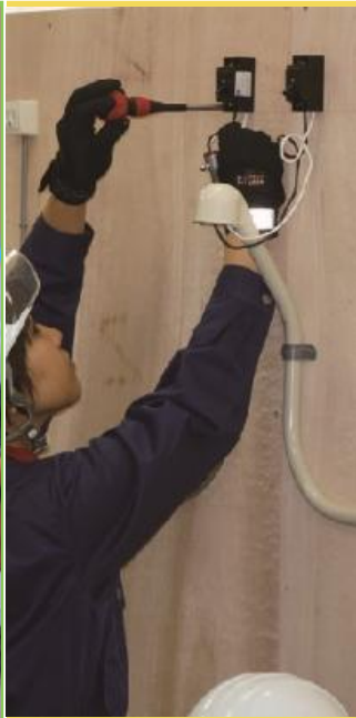
電気設備 サービス科