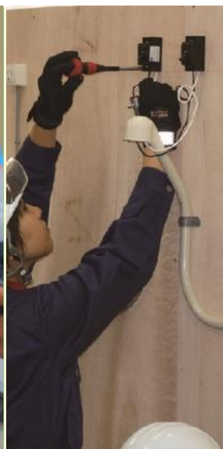
電気設備 サービス科