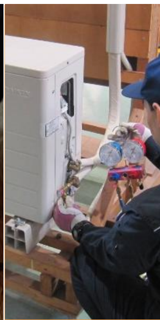
ビル設備 サービス科