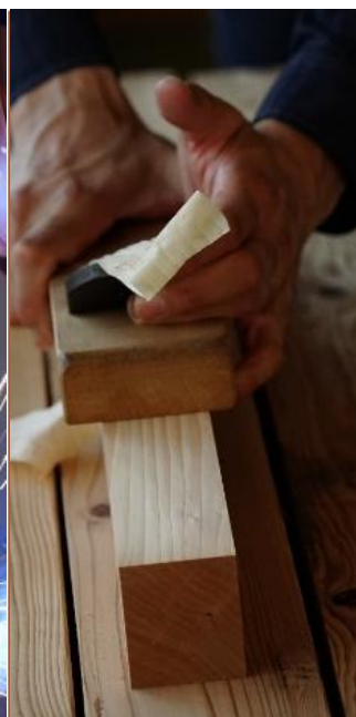
住宅 リフォーム科