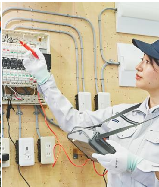
電気設備施工科 (企業実習付き)