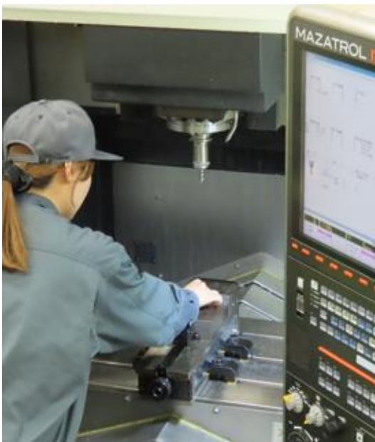
NCプログラミング科 (企業実習付き)