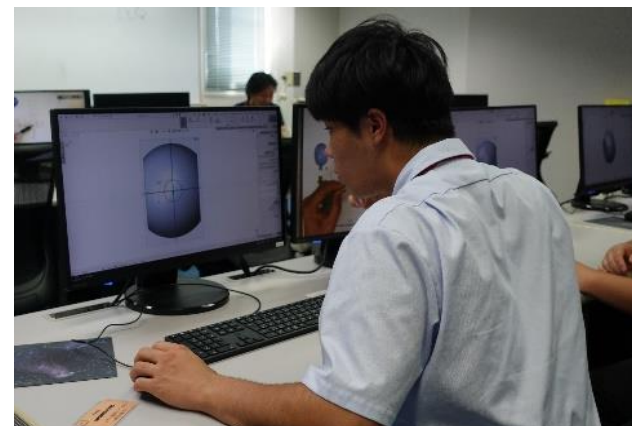
モデリングに集中！