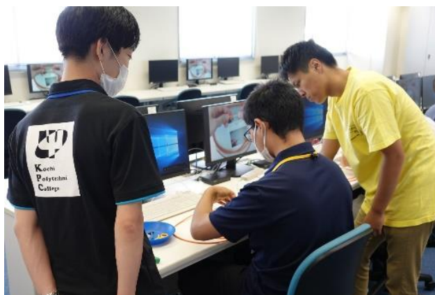
作成のコツをレクチャー