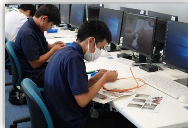
LANケーブルの製作に集中して取り組んでいます。