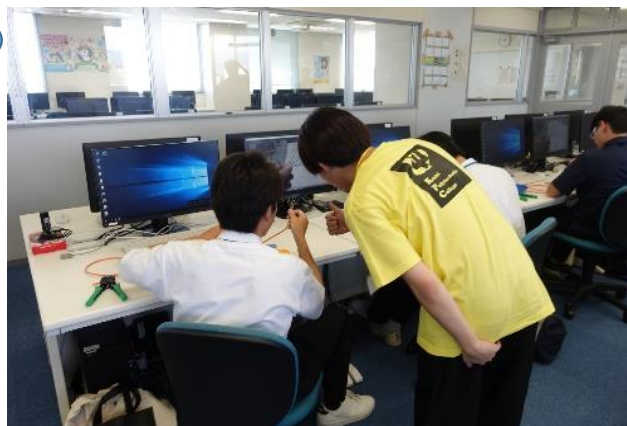
分からないことはKPCの学生が教えます