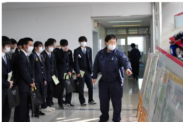
電子情報技術科の過去の総合制作実習の説明