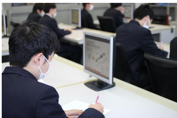
生産機械技術科の概要説明