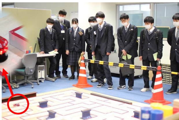
マイクロマウスが走る様子を見学