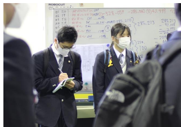
高校生の皆さんはメモを取りながら熱心に話を聞いていました