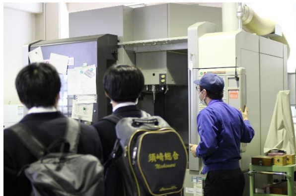
NC加工室でマシニングセンターの見学