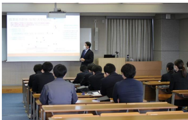
当校の学校紹介を聞いている様子

2月14日(水)に高知県立須崎総合高等学校の電気・情報専攻の2年生14名と引率の先生が当校の施設見学に訪れました。学校紹介の後、生産機械技術科、電子情報技術科の教室を見学し、その後電子情報技術科の体験授業を行いました。皆さん興味深々で熱心に先生の話聞いていました。今後の進路に向けて参考になるといいですね！