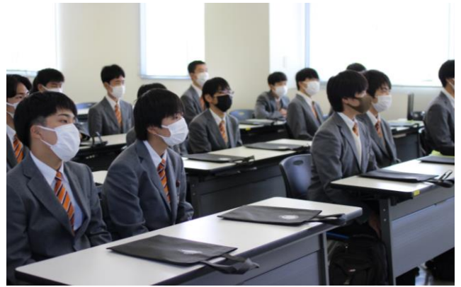
真剣な表情で説明を聞く学生