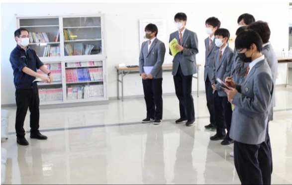
積極的にメモを取りながら説明を聞く学生