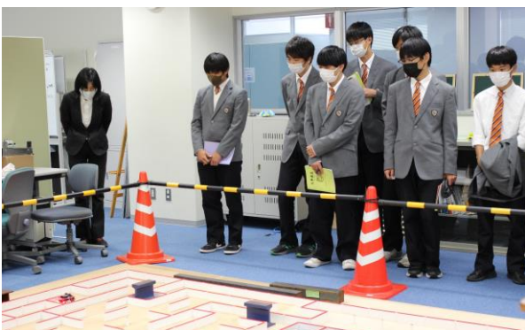
マイクロマウスがコースを走っている様子を見学