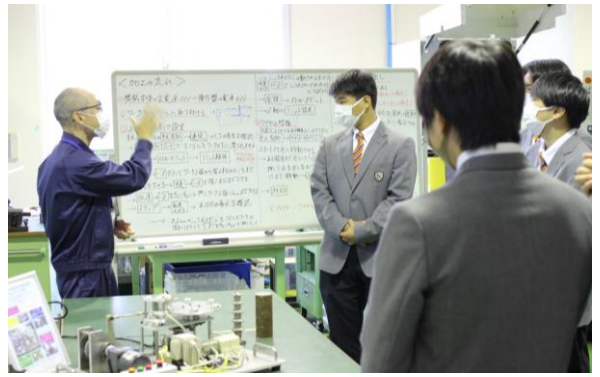
NC旋盤やマシニングセンタがある加工室で説明