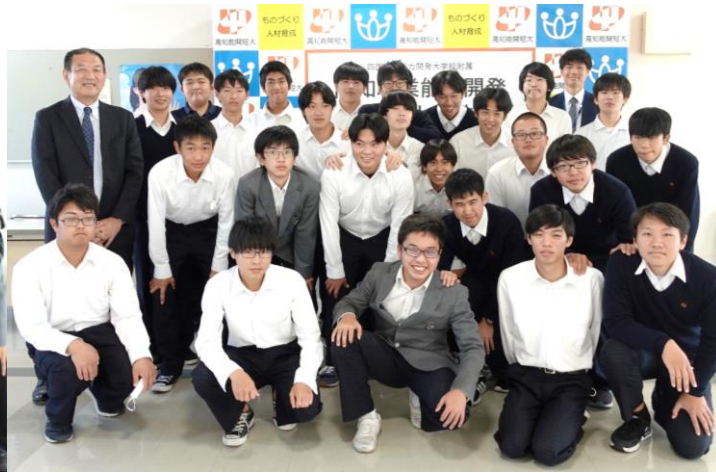
電子科2年生の皆さん

11月7日（火）に、高知東工業高等学校 電子機械科の2年生、11月8日（水）に、電子科の2年生が当校の施設見学に来校されました。