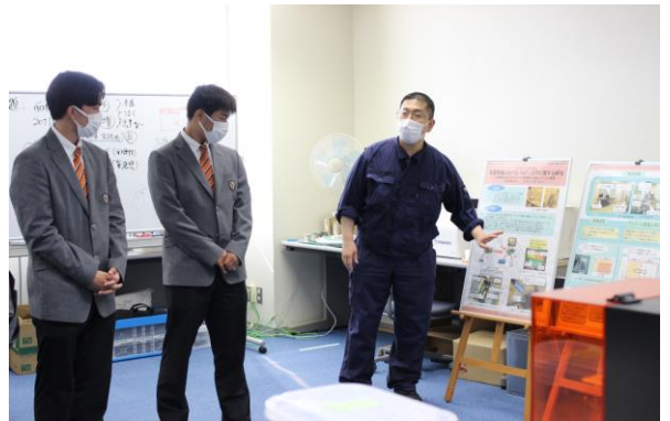
地元企業との共同研究についての説明