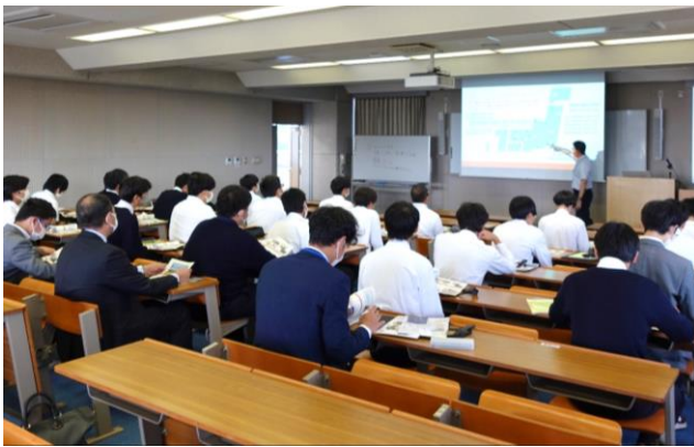
当校の概要説明の様子

当校の概要説明の後に、生産機械技術科、電子情報技術科の見学をしました。生徒の皆さんは、メモを取りながら、とても熱心に説明を聞いてくれました。「施設をまわって見学するのが楽しかった！」と感想をいただき、とても有意義な時間を過ごすことができました。