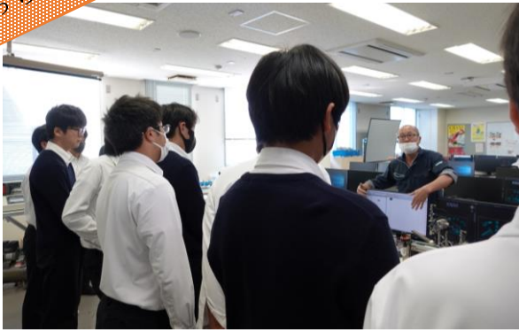
空気圧制御についての話を聞いています