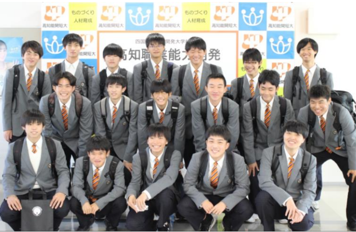
電子機械科2年生の皆さん