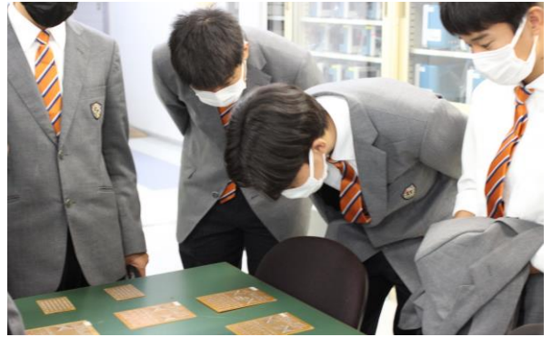
はんだ付けした基板を見ている