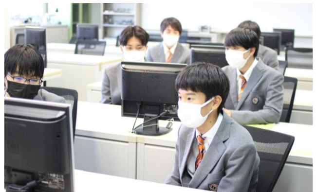
生産機械技術科の概要について説明