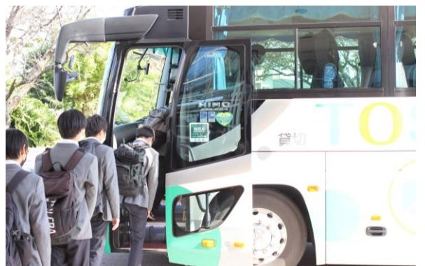
気をつけて帰ってくださいね～！

短い時間での施設見学でしたが、当校の魅力についてお伝えできたと思います。 12月17日（日）、第5回オープンキャンパスを予定していますので、ご参加をお待ちしています！