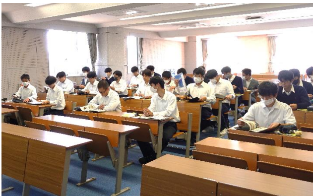
学校案内パンフレットや資料に目を通しています