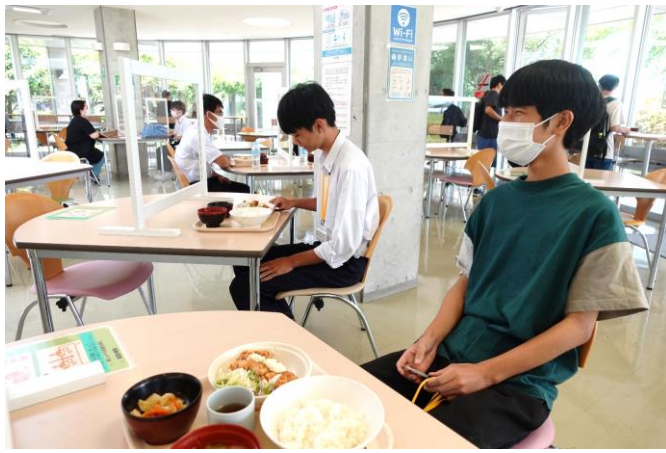
昼食は当校の食堂で「ランチ体験」 今回はチキン南蛮定食でした！