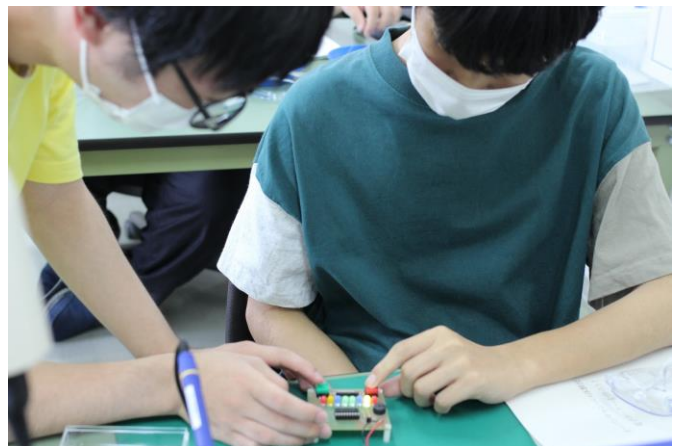
学生スタッフと高校生が出来上がったゲーム機で対戦