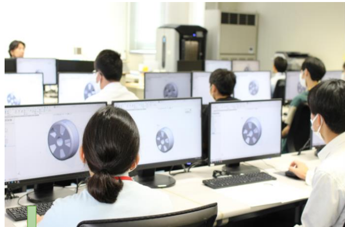
まず、車のタイヤをCADで作成します