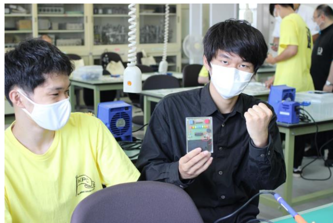
いちばん早く完成しました！ガッツポーズ！