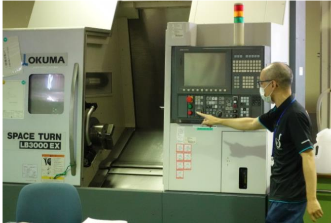
材料を自動で切削する機械「NC旋盤」の説明