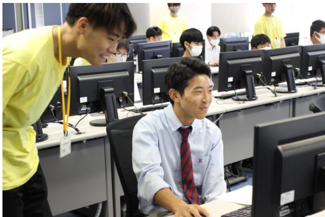
楽しそうに作業を進めています！分からないことがあれば学生スタッフが優しく教えてくれて安心！