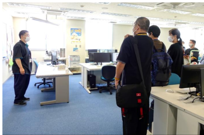
保護者の方々も校内を見学しました