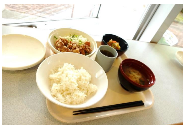
今回のスペシャルランチメニューは唐揚げ定食！とってもジューシー！！