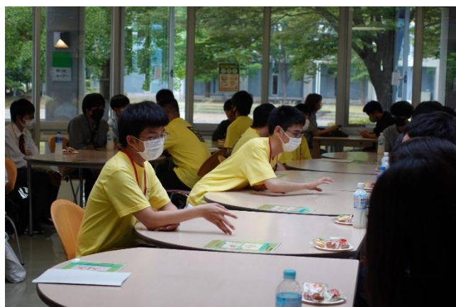
KPCの学生との交流コーナーでは色々な質問が飛び交っていましたよ！