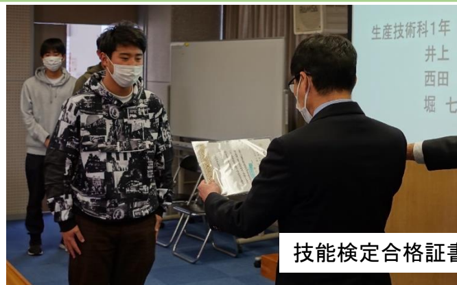
技能検定合格証書の表彰式の様子

技能検定とは、働くうえで身につける、または必要とされる技能の習得レベルを評価する国家検定制度です。試験に合格すると合格証書が交付され、「技能士」と名乗ることができます。現代の日本において、生産現場での技術継承は課題となっています。そういった中で、個人の技術力を表すこの検定は、さらに注目されていく資格となるでしょう。学生の努力の成果が実を結んだ形となりました。今後も他の職種や上の級の検定合格を目指して頑張ってください。