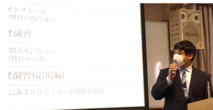
「インターンシップを通して、コミュニケーション能力の重要性を知った」と発表する学生