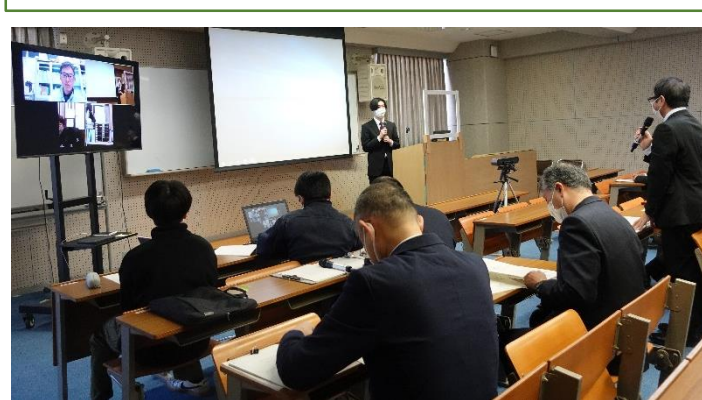
発表に対して、活発に、意見・質問が出ました。企業様にはzoomで報告会にご参加いただきました。

学生たちがインターンシップを通して取り組んだことや学んだことを報告するインターンシップ報告会が、2月8日（生産機械技術科）、2月9日（電子情報技術科）に開かれました。 インターンシップとは実際の企業で行う職場体験で、1年生全員が5～9日間の日程で行います。受け入れ先の企業様が毎回魅力的なプログラムを用意し丁寧に指導して下さいますので、これが決め手となって就職先を決めた学生もたくさんいます。 また、1年生にとって今回の報告会は大勢の前で自分の意見を述べる貴重な機会でした。緊張しながらも、作成したスライドを使い、一生懸命発表する姿に感動しました。この経験が今後きっと活かされていくことでしょう！ご協力くださった企業様ありがとうございました。