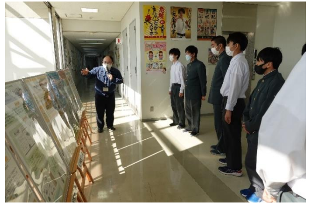
本館3Fでは作品紹介パネルによる総合制作実習の説明です！