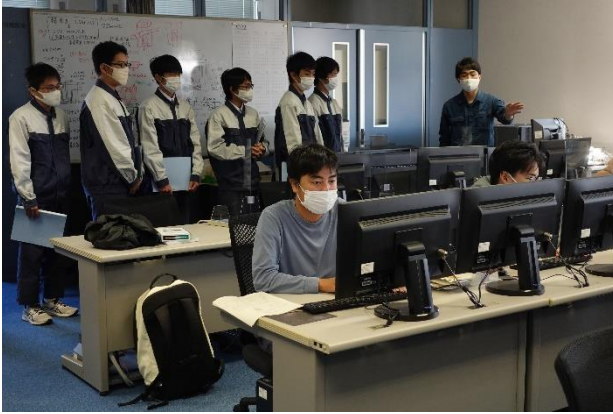
生産機械技術科2年生の総合制作実習の授業の様子も見学しました。