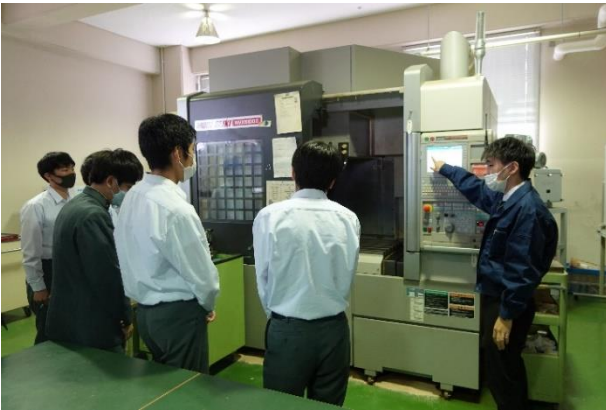
NC加工室では、マシニングセンターの動きや操作の説明があり興味深く聞かれていました。