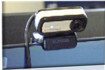
カメラに映すと、 AIが手の形を判定